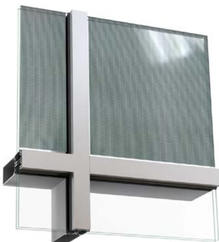
Genomsiktligt isolerglas. Tunnfilm. Bilden visar transparens 20 %.