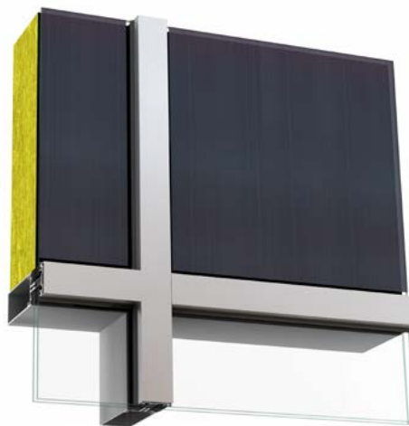
Uigennemsigtigt facadeglas. Tyndfilm.